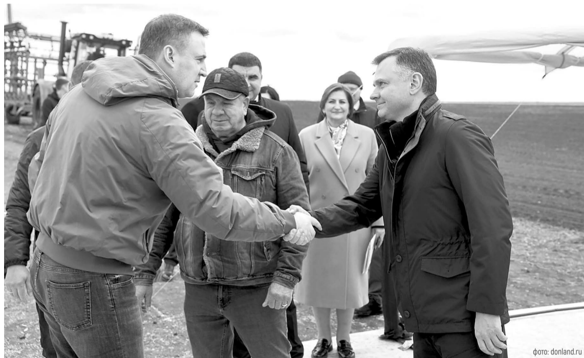
Дмитрий Патрушев и Юрий Слюсарь оценили ход полевых работ, побывав на полях сельхозпредприятия «Молчанов» Азовского района.

По мнению Дмитрия Патрушева, новые нацпроекты позволят Ростовской области эффективнее решать актуальные задачи в самых разных сферах.