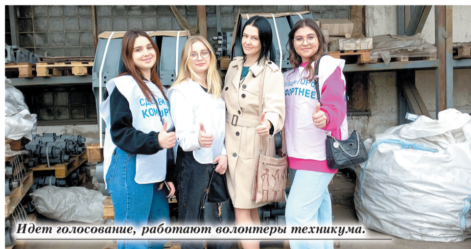
Идет голосование, работают волонтеры техникума.

ции пожилых людей в современном цифровом мире. Я тоже подключился к этому проекту в 2024 году и считаю его очень полезным!