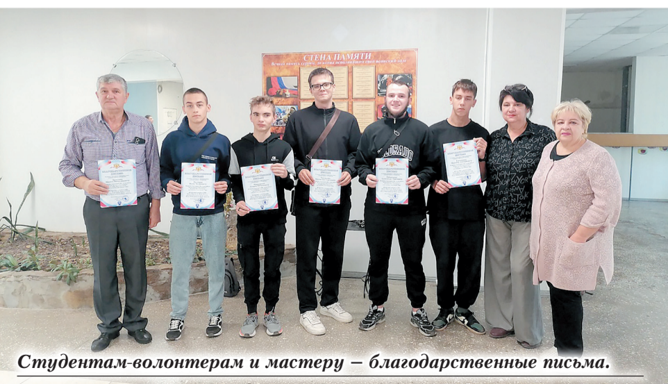
Студентам-волонтерам и мастеру — благодарственные письма.