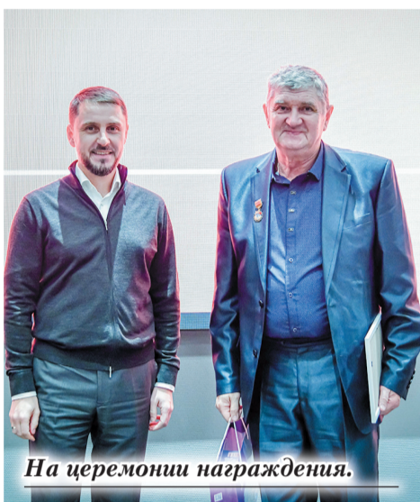
На церемонии награждения.