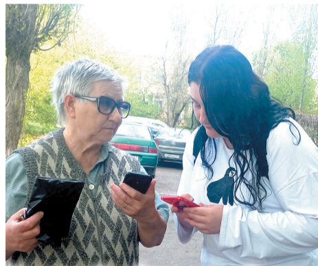
Проект «Комфортная среда». Идет голосование.

Нравится мне и что-то мастерить, с удовольствием веду для студентов мастер-классы по бумагопластике. В этой технике делали поздравительные открытки к 8 Марта для матерей и жен военнослужащих, находящихся в зоне проведения СВО. К мероприятиям, проводимым в техникуме, делаем и декорации. Работы очень много, главное,