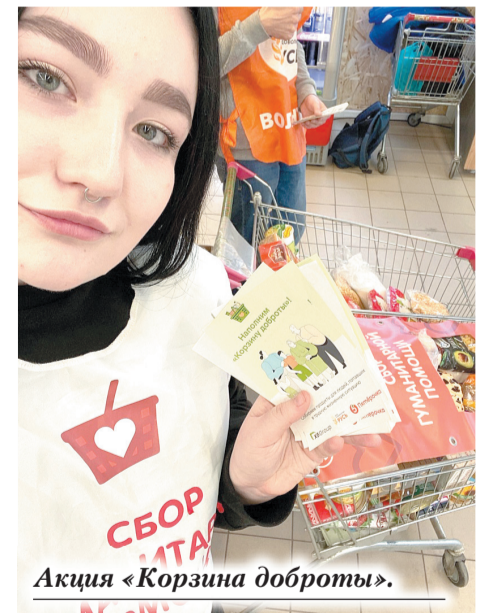
Акция «Корзина доброты».

которую мы ведем для участников СВО: сбор гуманитарной помощи, изготовление свечей, акции «Письма на фронт». Он сам участник специальной военной операции, ему эта тема особенно близка.