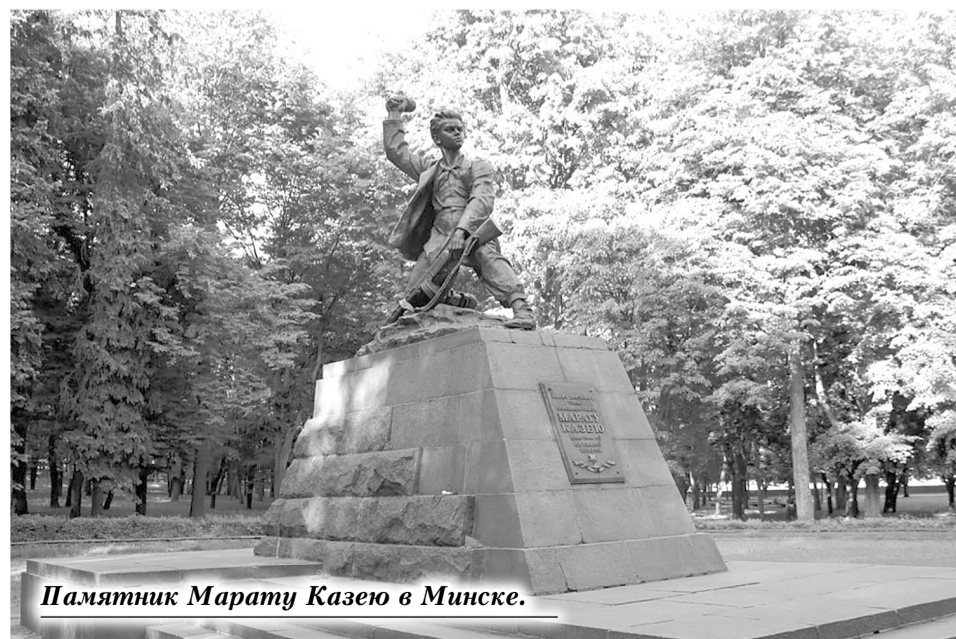
Памятник Марату Казею в Минске.

Оставшись в отряде, Марат стал разведчиком, участвовал в рейдах