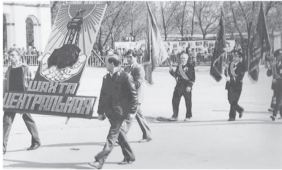
Труженики шахты «Центральной» на первомайской демонстрации.

Возвратившись, бригадир вернул породопогрузочную машину на место и основательно занялся организацией работы в бригаде. Прежде всего, увеличил её состав с десяти до двадцати шести человек, разделил на пять звеньев — по пять человек в каждом. Между звеньями началось соревнование за количество пройденных метров и за качество работы. Стали применять групповой метод бурения забоя, что позволило повысить производительность труда. Итогом