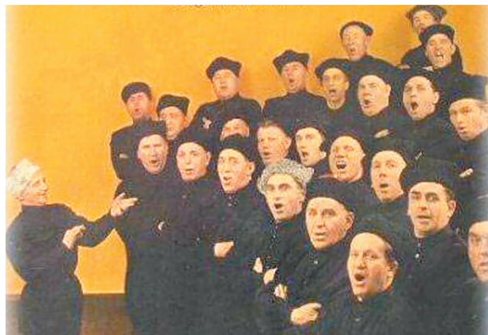
Хор Жарова во время выступления.

Характерно, что не только простые граждане европейских государств, но и члены королевских семейств Европы с участием относились к судьбе донских казаков. Казаки-гундоровцы удостоились чести встречаться не только с членами королевской семьи Великобритании, но и других стран. Так, например, в 1926 году бельгийская королева восхищалась артистическими качествами уроженцев станицы, и узнать об этом можно было из журнальной публикации: