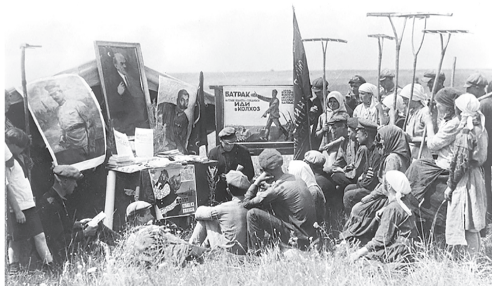
Культбригада на полевом стане.

ганизовать 500 детских колхозов, 250 детских птицеводных, 100 детских молочно-животноводческих, 100 детских кролиководческих, 100 детских свиноводческих, 500 детских садово-огородных, 200 детских шелководных и 50 детских пчеловодных артелей.