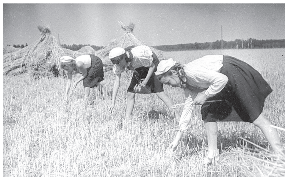
Пионеры собирают колоски.