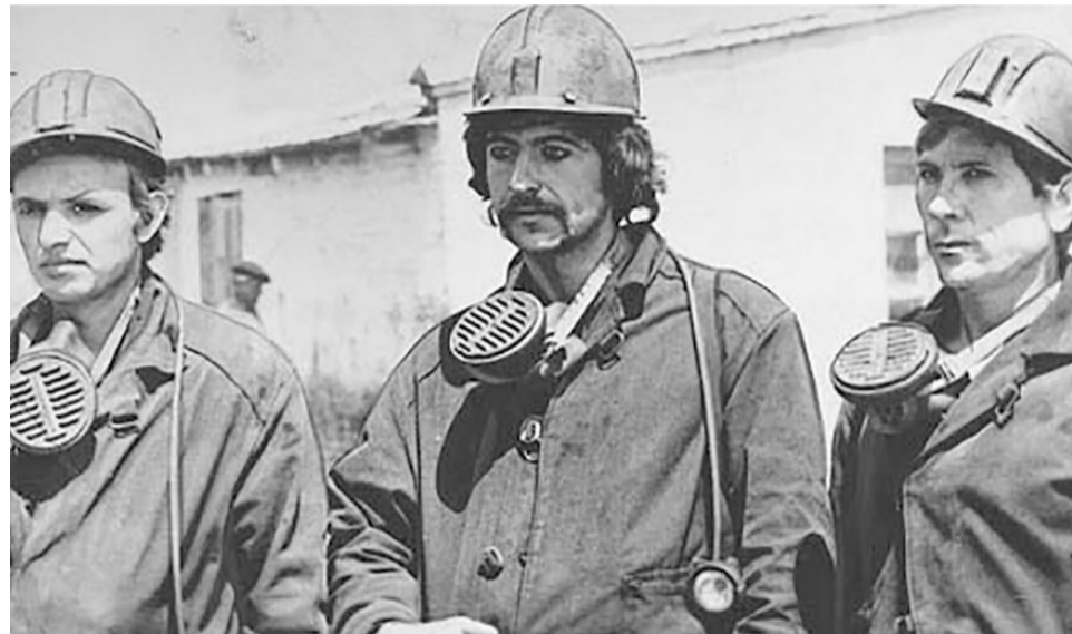
Горняки перед спуском в шахту.