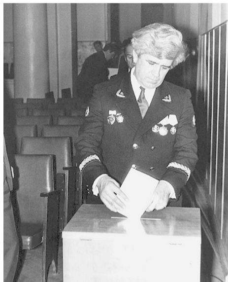
Голосование на партийной конференции.

На берегу Северского Донца вырастет новая база отдыха для трудящихся с плавательным бассейном и другими спортобъектами. Значительно благоустроится пляж. Градостроительный совет одобрил генеральный план развития города.