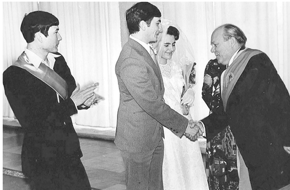
Создана ещё одна донецкая семья.

как бы там ни было, мы-то знаем, что значительная часть третьего микрорайона была заселена именно работниками Донецкого экскаваторного завода.