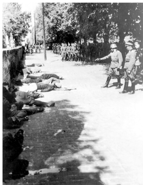
Расстрел в Ростове-на-Дону 25 июля 1942 года.