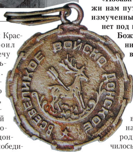
Медаль «За освобождение Дона», 1918 год.

Опять, как и раньше, были разрешены ярмарки в станицах. На них свозили всё, что можно было продать из произведений своего хлебоборобского и другого труда. В торговых рядах появилась рыба с нижнего