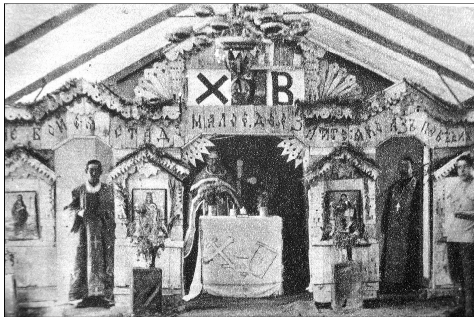
Палаточная церковь на греческом острове Лемнос.

кормить Красную армию и добиться полного обсеменения полей на юге России. Не хотели казаки этого делать или же, зная про установленные нормы изъятия, так называемых, хлебных излишков, сеяли только для своих нужд. Думать о нуждах всей страны их тогда ещё не приучили.