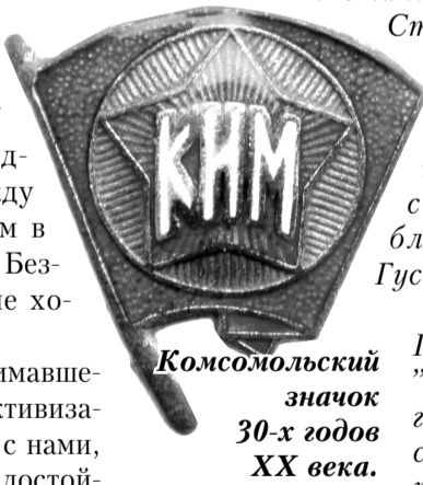
Комсомольский значок 30-х годов XX века.

Станица Гундоровская в период проведения сплошной коллективизации на Дону входила в Каменский район Шахтинско-Донецкого округа Северо-Кавказского края. И главным печатным органом в нём была газета «Красный Шахтёр», а роль органа молодёжной печати выполняла газета