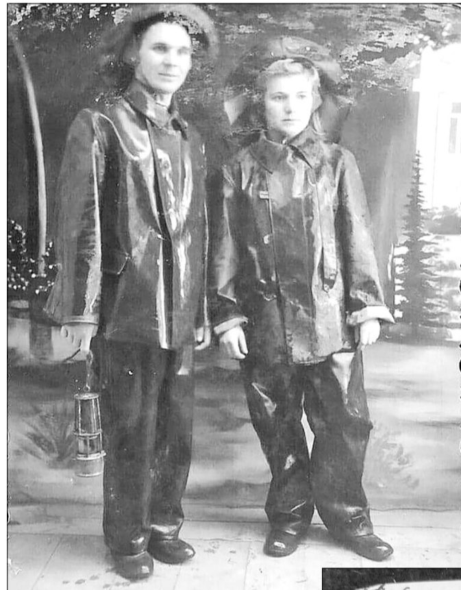
На шахте «Северо-Гундоровской» № 3. 1948 год.

И вот мы приехали в Изварино. Было это февральской морозной ночью. Станция была разрушена, лишь стены прочно стояли. Поэтому нас собрали в какой-то каморке (а было нас человек пятьдесят), где мы немного отдохнули. Потом подошёл паровоз. Обычный закопчённый паровоз,