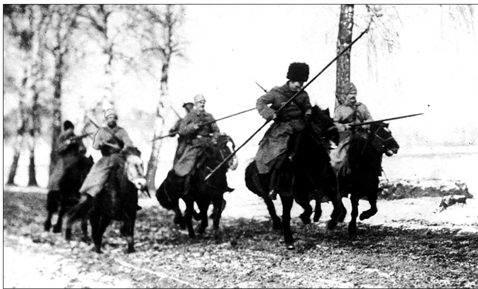
Казаки, вооружённые пиками.

ронский чернозём. Куда там до него гундоровским пескам, суглинкам да хрящам!