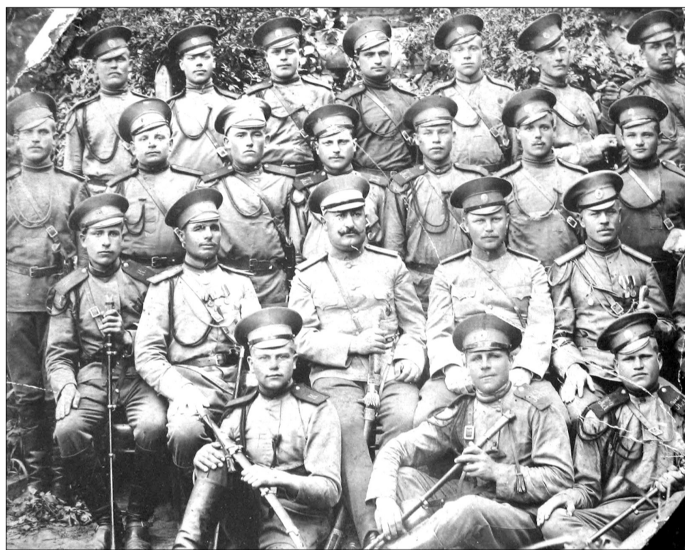
Групповое фото казаков 10-го Донского казачьего полка.

Шляхтин записал в маленький блокнотик с привязанным на шнурке удоб-