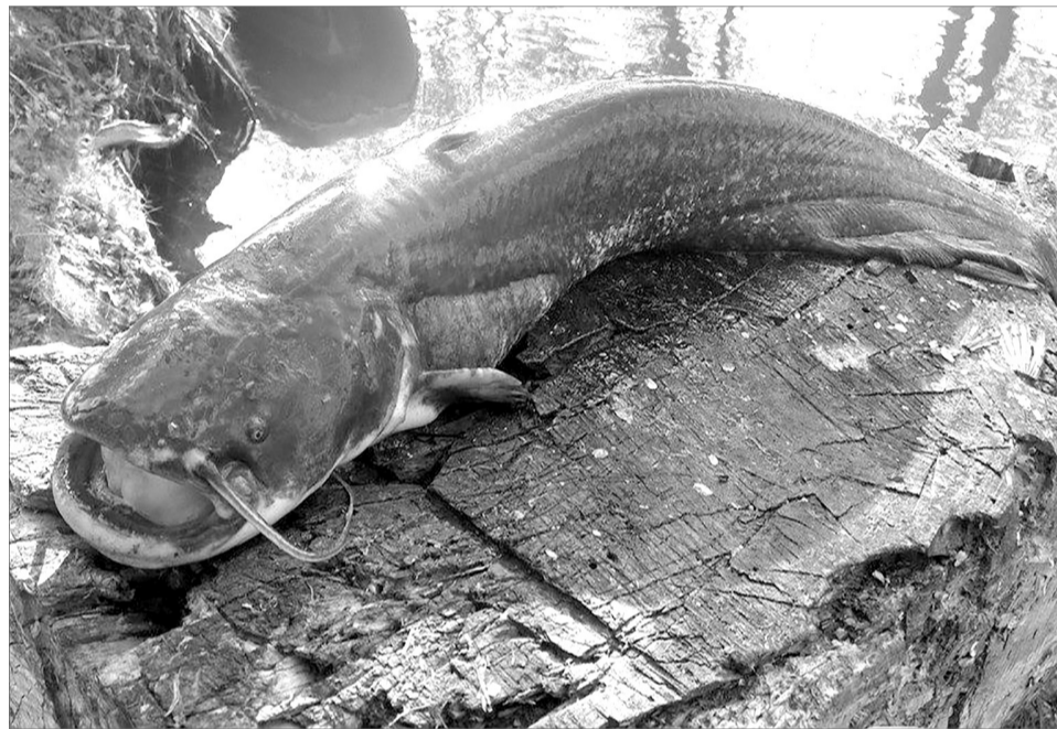
Речная рыба сом.

Всё! На Северский Донец пришла настоящая зима, а вместе ней — и долгожданная рыбалка. Сразу же посылались разведчики, чтобы проверить толщину льда по всей ширине реки и определить, когда можно будет заняться любимым подлёдным ловом