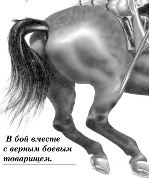
В бой вместе с верным боевым товарищем.

Да, горе простаку, попавшему в руки барышников! Хотя, справедливости ради, следует сказать, что в донской прессе был такой информационный уголок, похожий на сегодняшний «уголок Остапа Бендера». В заметках рассказывалось обо всех уловках